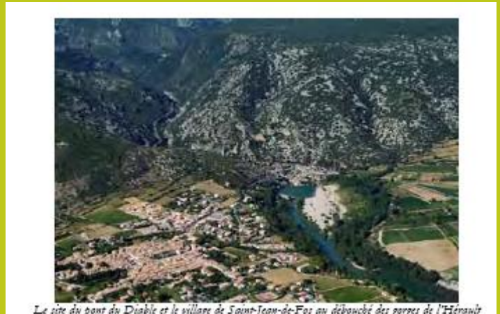
Le site du pont du Diable et le village de Saint-Jean-de-Fos au débouché des gorges de l'Hérault