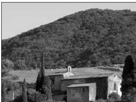
Illustration 10 : Autour du Musée d'art moderne de Céret.

merveille, il est évident que ses collections présentent un intérêt réel. Mais il s'agit ici de travailler le musée indépendamment même de son contenu, sous-entendu que sa qualité justifie ou non le déplacement. Ce qui est considéré dans cette analyse, c'est son pouvoir économico-touristique, et ce que l'on s'attache à démontrer, c'est qu'il peut être (et qu'il est) instrumenté comme dispositif touristique par l'économie, indépendamment de ses qualités (au sens philosophique du terme) culturelles.