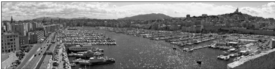
Illustration 14 : Vieux-Port de Marseille.