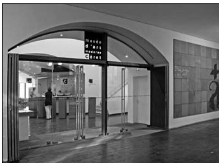
Illustration 9 : Musée d'art moderne de Céret.