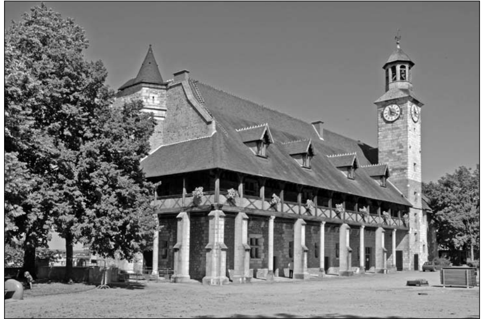
Illustration 4 : Les musées comme stratégie de valorisation d'un territoire : Exemple du Musée des musiques populaires de Montluçon.

Le musée étant un dispositif qui peut modifier ou fabriquer l'image d'une ville et la rendre attractive, il est également instrumenté par l'économie touristique comme dispositif de séduction pour servir des stratégies de redynamisation. Il est