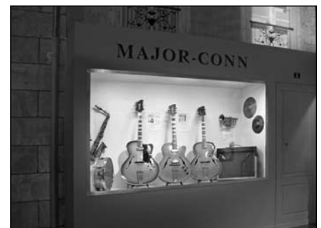
Illustration 6 : Exposition consacrée aux guitares Jacobacci, Musée des musiques populaires de Montluçon.