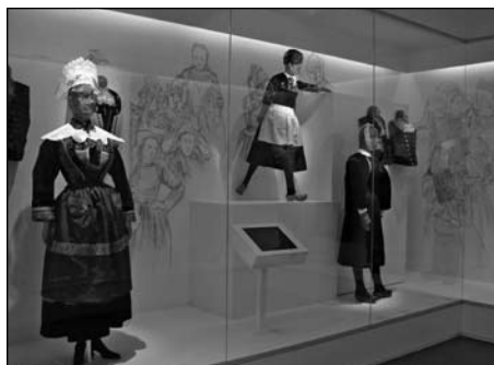
Illustration 2 : Exposition «Travailler du chapeau – Le chapelier et le modiste» (18 mai au 10 novembre 2007), Musée de Bretagne, Rennes.