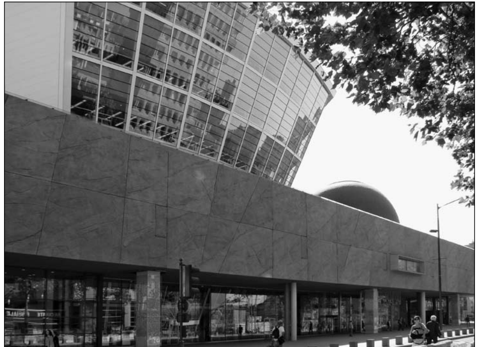
Illustration 1 : Les musées de société à vocation identitaire : Exemple du Musée de Bretagne, Rennes.

Sur le premier point, il est bien évident que, comme nous sommes entrés – avec les technologies de l'information et de la communication (TIC) et plus encore avec l'avènement du Web 2.0 – dans une nouvelle « ère cognitive » (Lévy, 1994), nous voici également désormais dans une « ère du loisir » qui, au-delà des affrontements de valeurs qui n'ont jamais été aussi prégnants en France, apparaît désormais comme un « état de fait » difficilement discutable. Si l'on considère la réduction et la réorganisation du temps de travail, l'allongement de la durée de vie et la pratique culturelle des « jeunes retraités » au fort pouvoir d'achat, on comprend fort bien que ces modifications structurelles autant que conjoncturelles affectent de façon