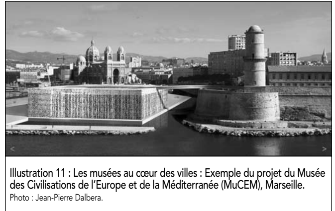
Illustration 11 : Les musées au cœur des villes : Exemple du projet du Musée des Civilisations de l'Europe et de la Méditerranée (MuCEM), Marseille.