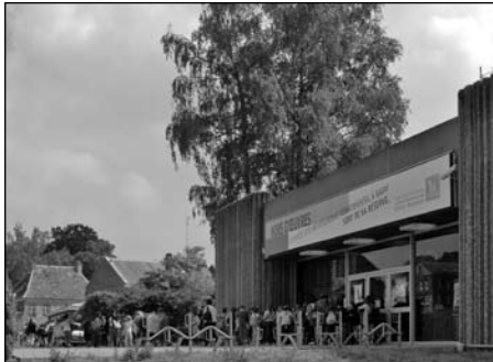
Illustration 7 : Musée archéologique de Bavay.