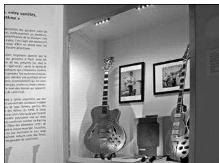
Illustration 5 : Exposition consacrée aux guitares Jacobacci, Musée des musiques populaires de Montluçon.