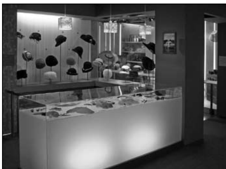
Illustration 3 : Exposition «Travailler du chapeau – Le chapelier et le modiste» (18 mai au 10 novembre 2007), Musée de Bretagne, Rennes.