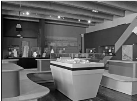
Illustration 8 : Musée archéologique de Bavay.