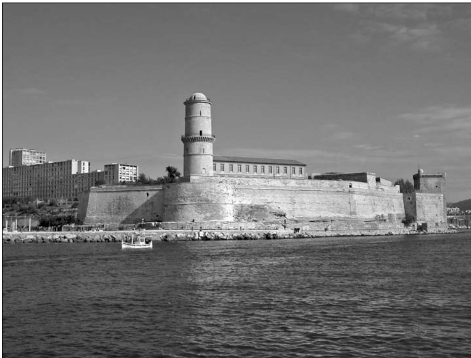
Illustration 12 : Fort Saint-Jean, Marseille.